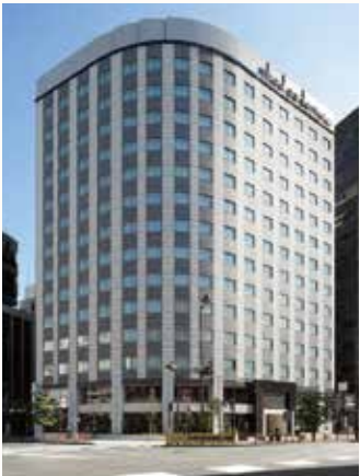
三井ガーデンホテル上野

上野駅からほど近い便利な立地に プライベート性の高い デザイン性豊かな滞在空間をご用意しました。