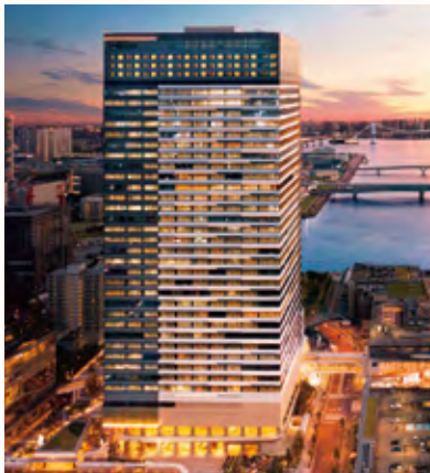
三井ガーデンホテル豊洲プレミア

ベイエリアや都会のパノラミックな眺望が 愉しめるゲストルームに、 最上階36階には内湯・外湯を完備した 宿泊者専用大浴場をご用意。 天空からベイエリアを一望する、 東京をクルーズするホテルへ。