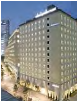
三井ガーデンホテル汐留イタリア街

落ち着いた中にも、遊び心のある おとなのイタリアンスタイルを とり入れた館内や客室。 ゲストの滞在スタイルに合わせた ホスピタリティあふれるサービスを ご用意しております。