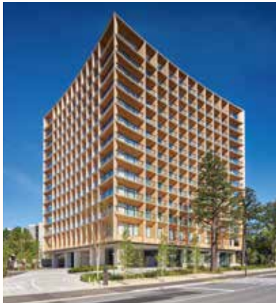
三井ガーデンホテル神宮外苑の杜プレミア