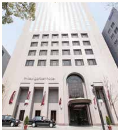
三井ガーデンホテル広島

生まれ変わった客室は、 瀬戸内の海や広島の特産品をモチーフに センス溢れるスタイリッシュな インテリアが印象的です。 ビジネスや観光で訪れるすべてのお客様へ、 広島がより楽しくなる機能的で より快適な空間を実現しました。